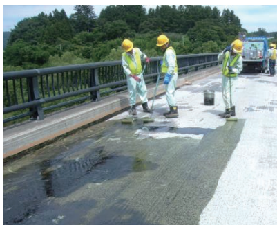
プライマー塗布状況