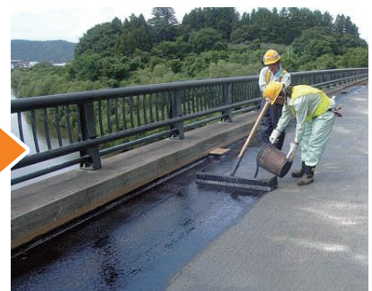
薄層舗装舗設状況