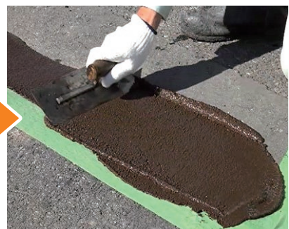
スーパーロメンパッチ均し状況